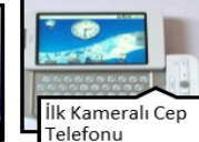
İlk Kameralı Cep Telefonu • 1999