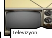
Televizyon • 1923