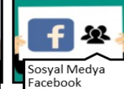
Sosyal Medya Facebook • 2004