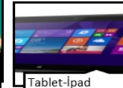
Tablet-İpad • 2010