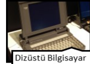
Dizüstü Bilgisayar • 1983