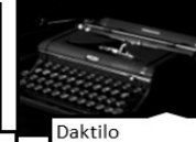
Daktilo • 1829