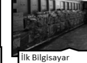
İlk Bilgisayar • ENIAC - 1946