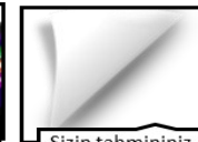
Sizin tahmininiz .....

İnsanlık, tarih boyunca bilgi üretimi ve iletişim için çeşitli teknikler kullanmışlardır.