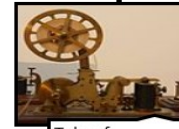
Telgraf • 1792

BT.5.1.1.2. Geçmişten günümüze bilgi ve iletişim teknolojilerindeki değişimi fark eder.