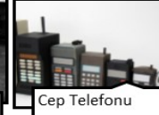
Cep Telefonu • 1973